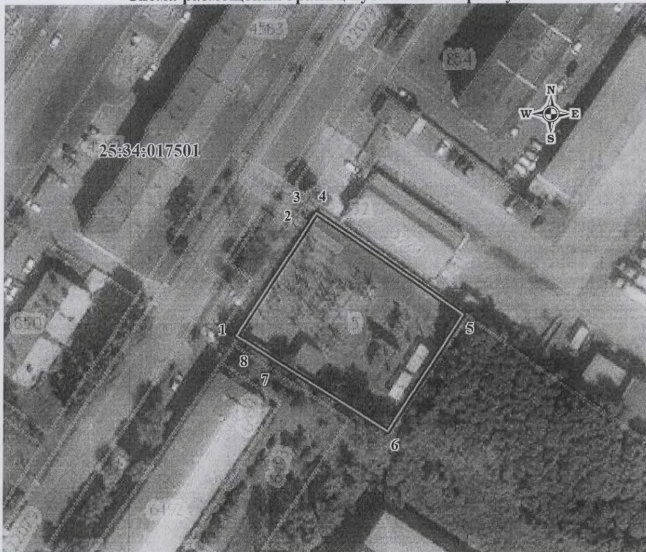
Схема размещения границ публичного сервитута

Утверждена постановлением администрации Уссурийского городского округа от 15.03.2020 № 694