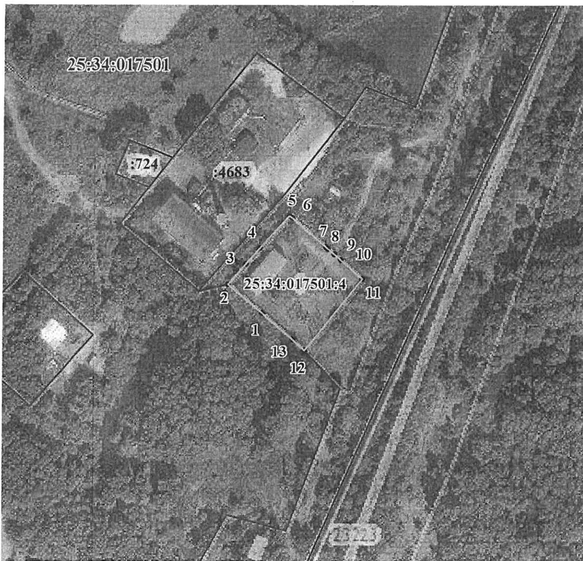
Схема размещения границ публичного сервитута

Утверждена постановлением администрации Уссурийского городского округа от 25.03.2020 № 693